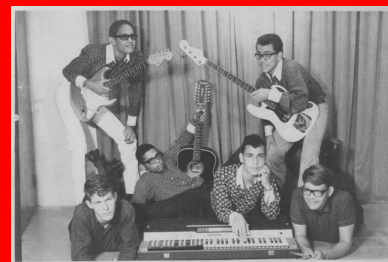
The Strangers 1964—2019